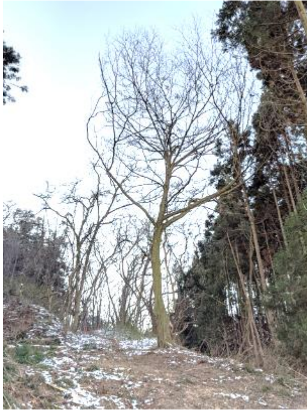
<杉の木の下に植えていた桜、紅葉の木は無事に残りました。2年後には枝が復活して彩りの森になります。 春の桜の花 秋の紅葉>